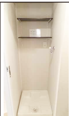
上部に可動棚を設置した洗濯機置場