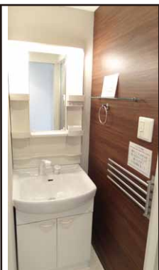
タオル掛け・自動点灯ライト 機能的にまとめた洗面台