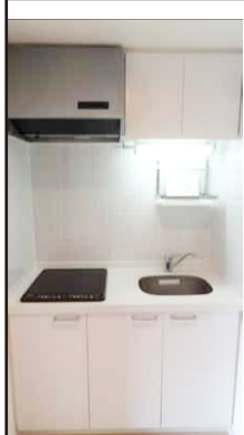
IH コンロで掃除も楽々！