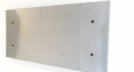
マグネットが使えるインテリアボードを設置 写真やスケジュールを貼ってみる!?