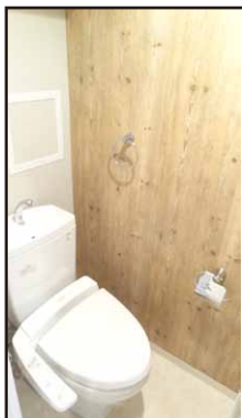
嬉しいウォシュレットが標準装備！